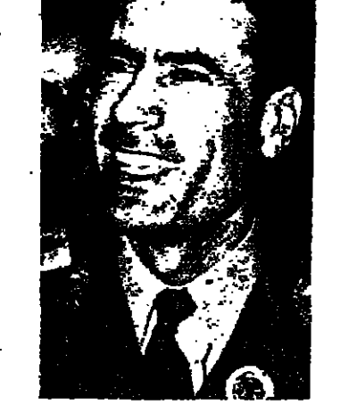
القذافي الى الرئيس الامريكاني جيمي كارتر